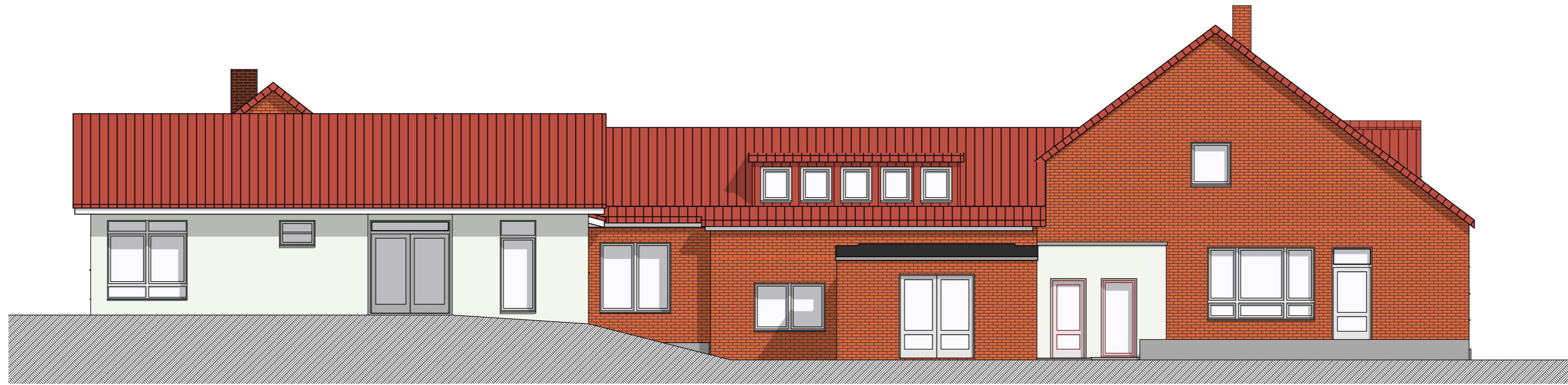
Ansicht Spielplatz 1:100